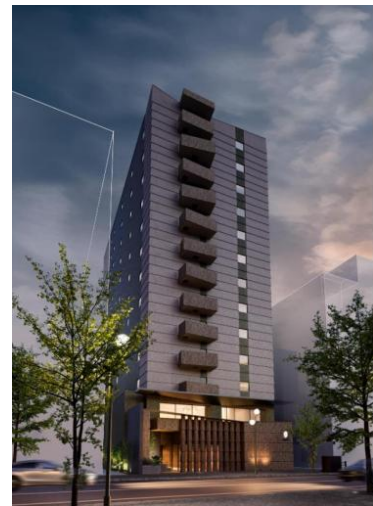
(仮称) 中央区南 6 西 4 プロジェクト

これまで全国の主要都市において多数のホテルを開発してきた実績とノウハウを活かし、地域に根ざした価値ある空間を提供してまいります。