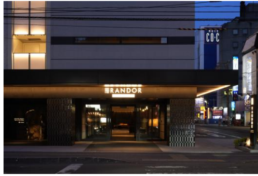
エントランス外観