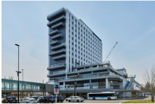
エスコンフィールド HOKKAIDO ホテル北広島駅前