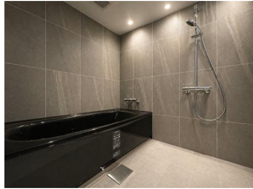
プレミアムルーム ユニットバス