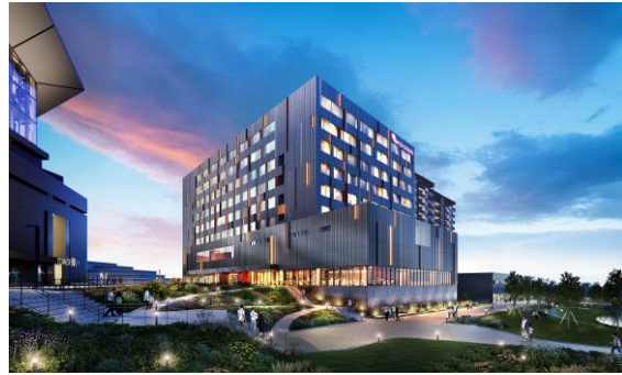
(仮称) 北海道ボールパークホテル