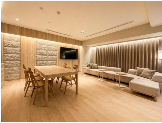
プレミアムルーム客室