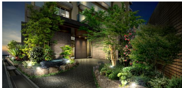
エントランスアプローチ完成予想図