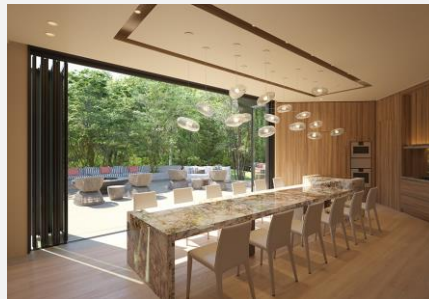
シェフズキッチン完成予想図