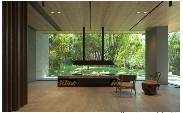
B棟エントランス完成予想図