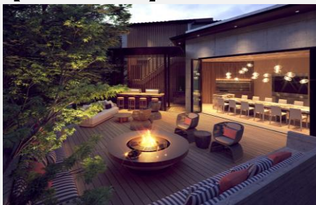
ガーデンテラス完成予想図