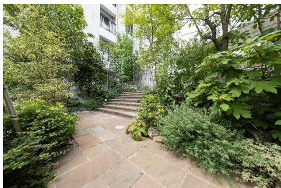
ガーデンアプローチ

当該物件の外観は歴史や文化が感じられる大倉山の街並みに溶けこむよう、白を基調としたデザインとしております。内部には吹抜を設けるほか、角住戸率80%の採光・通風に優れた住戸プランを採用することで開放的な空間を提供しております。また、約2.4mの敷地内高低差を利用した立体的なガーデンアプローチには、多様な植物を配植し、地域に開かれた四季を感じられる心地よい空間を提供しております。また、樹名札には植樹されるまでの過程を視聴できるQRコードを載せ、住民と地域の皆様の自然への意識を高める働きかけに取り組んでおります。