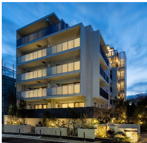
大倉山のまち並みに合わせた白い外観

「地域に開く」というキーワードは、昨今ではグッドデザイン賞でも度々登場する言葉となりつつあるが、本計画はそれを本質的に問い直し、試みているように感じられる。ただ外から入ることができるといったことではなく、並行に走る道路をだれもが行き来できる動線を敷地内に設け、またそこが公園のように緑豊かな環境を設けられていることで、まちの中での人の流れまで変えてしまうような計画になっている。たいへん意欲的な計画である。