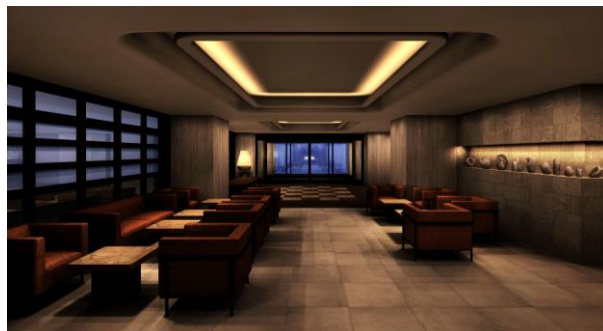
カフェスペース完成予想図