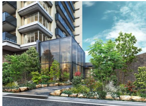
エントランスアプローチ完成予想図