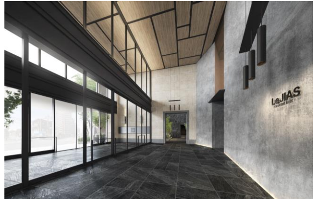
エントランスホール完成予想図