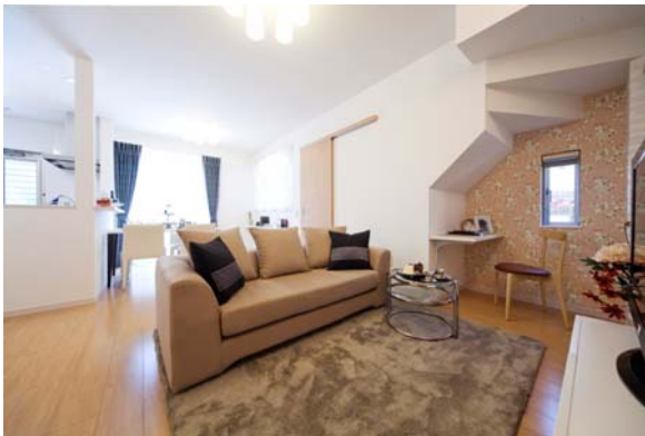
リビング・ダイニング