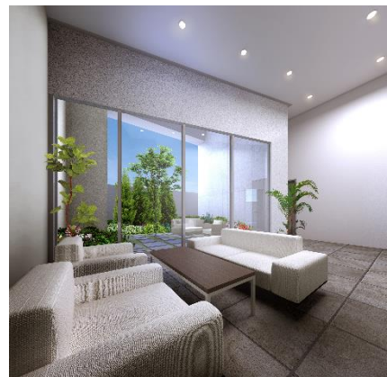
ガーデンテラス、ラウンジ完成予想図