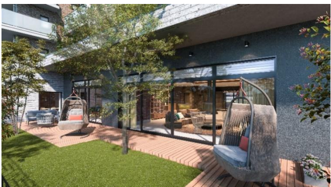
デッキテラス完成予想図