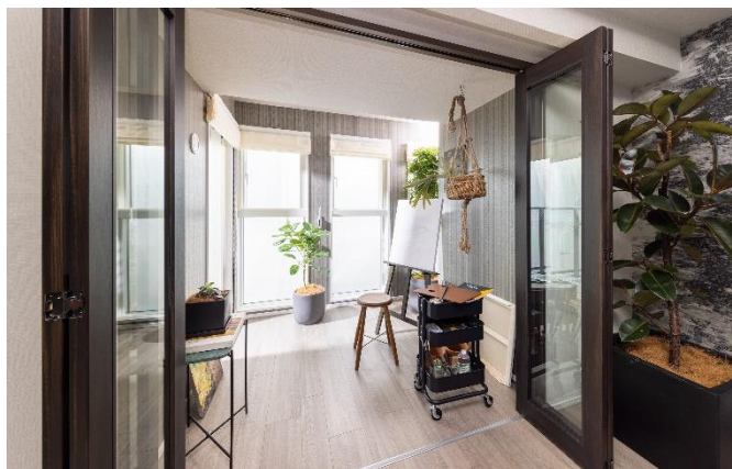
F テラス (モデルルーム撮影)

セカンドハウスやワーケーションなど様々なライフスタイルに合わせてお住まいいただけるよう、専有面積は43.43㎡～137.55㎡、間取りは1LDK～3LDKまで全20タイプの豊富なプランをご用意しております。