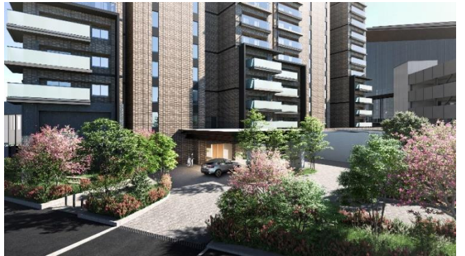
エントランスアプローチ完成予想図

エントランスアプローチは、様々な種類の植栽を配して奥行きを演出するほか、建物入口上部には大きな屋根を設け、雨天や降雪時なども車の乗り降りがしやすいようにしております。