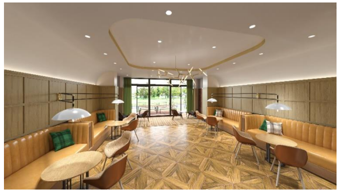
クラブハウス完成予想図