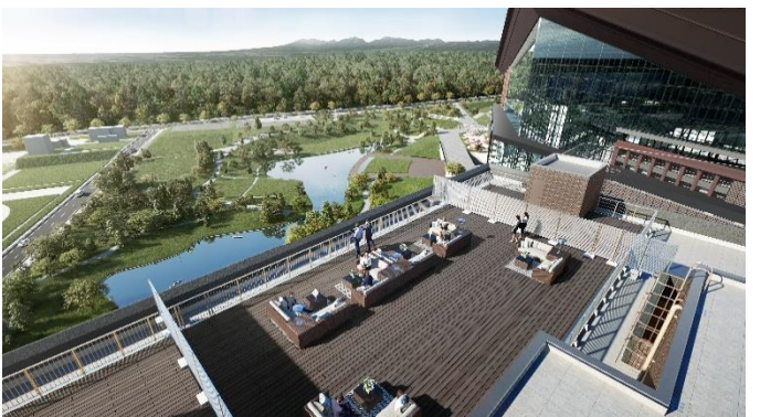
北海道ボールパーク F ビレッジ・屋上共用テラス完成予想図