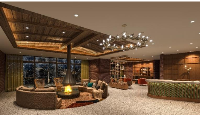
ウォームリビング完成予想図

屋上に共用テラスを設けることで、F ビレッジ内の自然やその先に広がる北海道の原生林を見渡せる唯一無二の眺望をお楽しみいただけます。