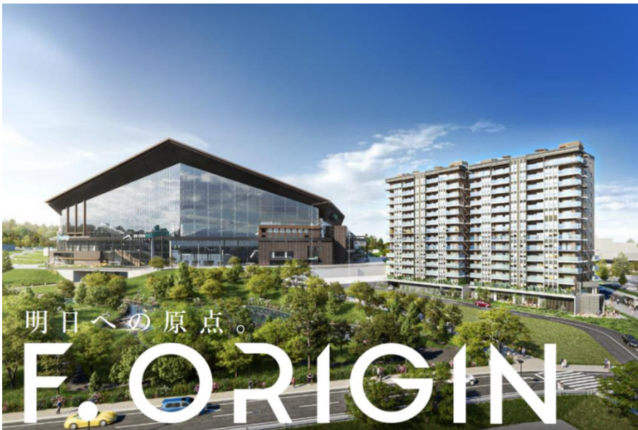
北海道ボールパークFビレッジイメージ図・マンション外観完成予想図