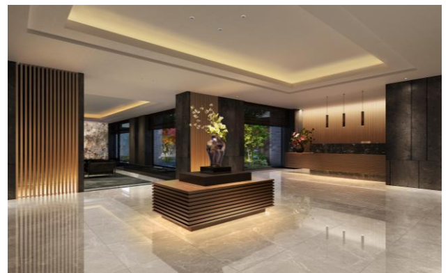
エントランスホール完成予想図