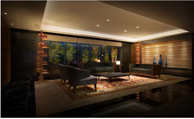
ラウンジ完成予想図