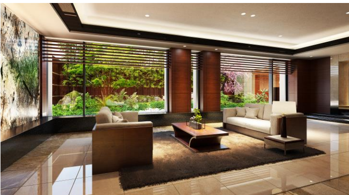
ラウンジ完成予想図