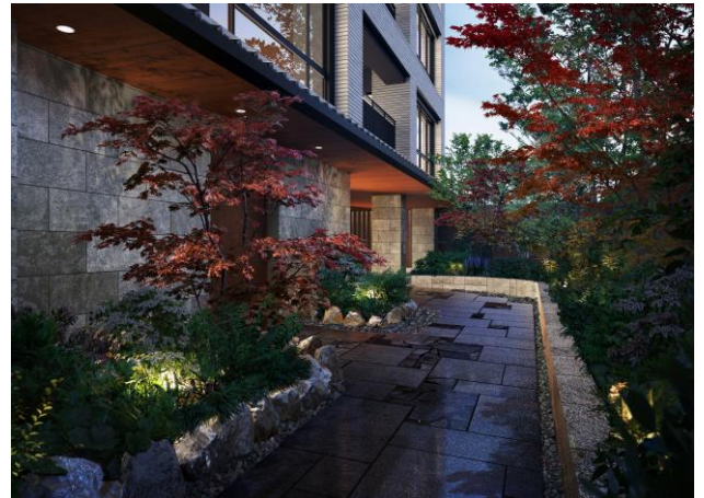
エントランスアプローチ完成予想図