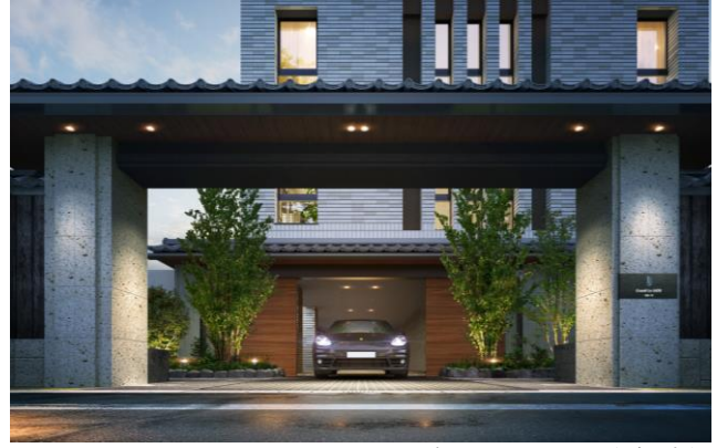
ゲートエントランス完成予想図