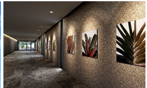
ミュージアムコリドー完成予想図