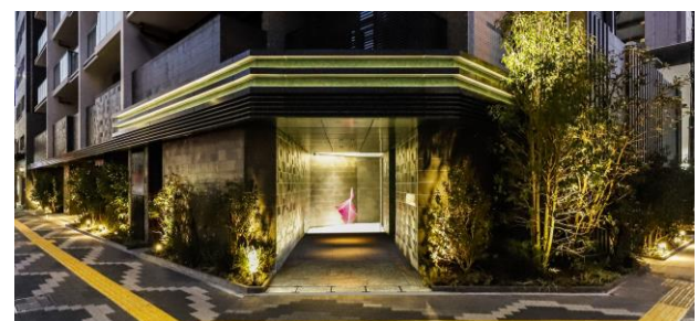
エントランスアプローチ