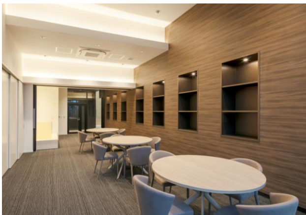
オーナーズラウンジ