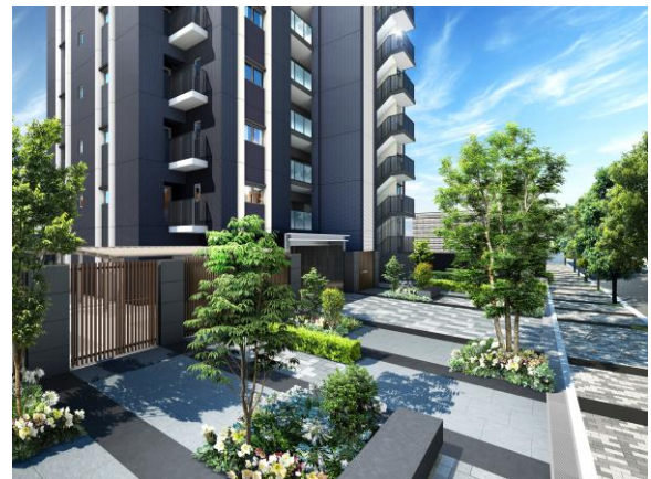
ブリーズスクエア完成予想図