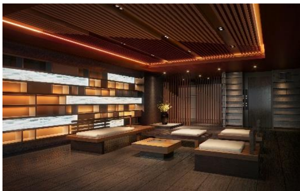
エントランスホール内

※掲載の外観完成予想CG及びエントランスアプローチ完成予想CGは設計図書を基に描き起こしたもので、行政官庁の指導、施工上の都合および改良のため外観・外構・仕上・仕様・形状・色彩等に一部変更が生じる場合があります。