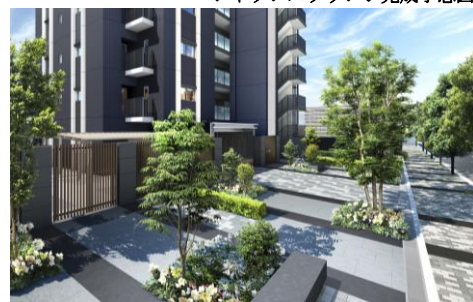
ブリーズスクエア完成予想図