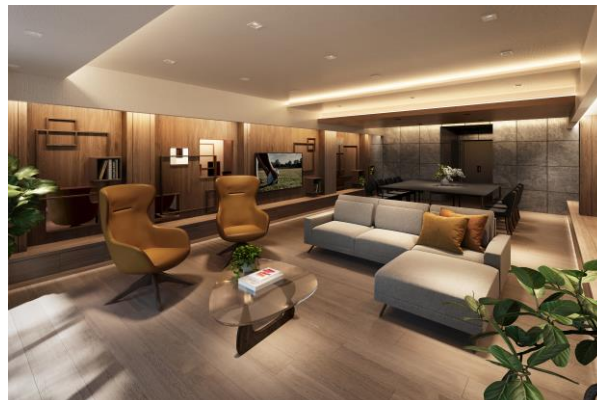
ラウンジ完成予想図