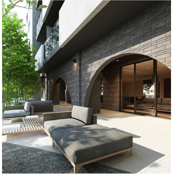
プロムナード完成予想図

専有部では、柱を室内に出さないアウトポール設計を取り入れております。『レ・ジェイドシティ橋本 I』は、コンパクトな広さで機能性・快適性を追求したシングル・デュックス向け、『レ・ジェイドシティ橋本 II』は、使いやすさにこだわった設備・仕様と豊富な収納を設けたファミリー向けのプランとし、多様なライフスタイルに合う住空間を提供します。