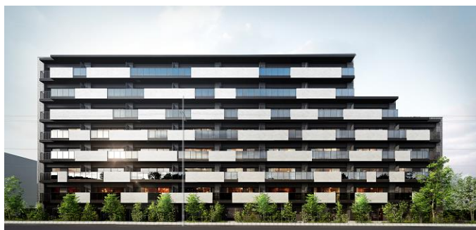
レ・ジェイドシティ II 外観完成予想図