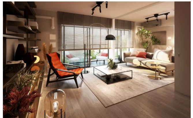
レ・ジェイドシティ橋本 II A type 室内完成予想図