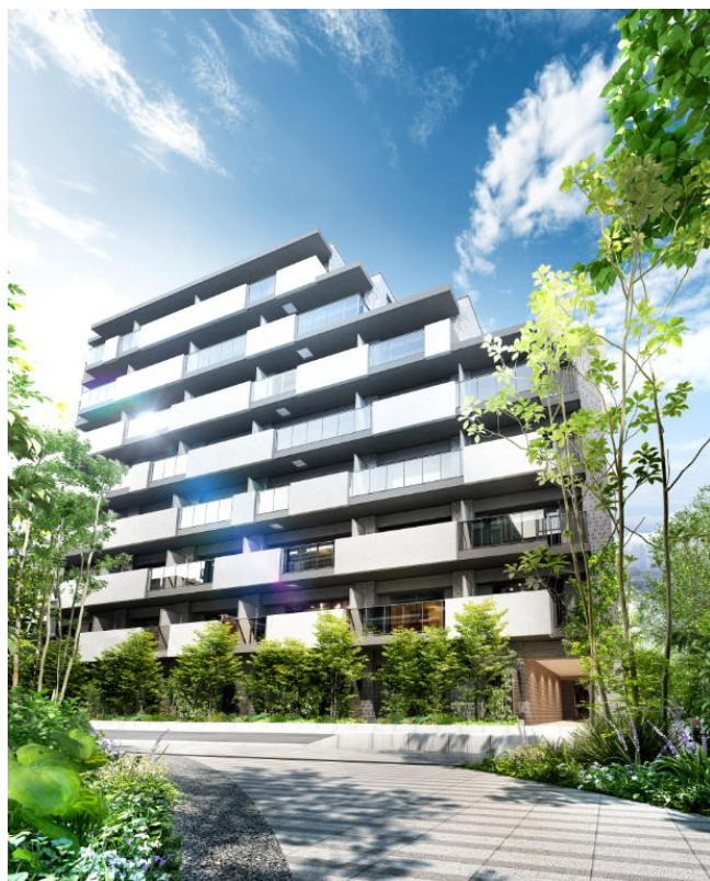
レ・ジェイドシティ I 外観完成予想図

外観は、多様な色彩と質感のタイルを組み合わせることで、統一感を持たせながら洗練された雰囲気表現した気品漂うデザインとしました。敷地東側に設けるプロムナードでは、豊かな植栽を配し、季節の移ろいを感じられるほか、晴れの日にはmet hall（集会室）にある家具を外に出して、お住まいの方同士のコミュニケーションの場として利用できます。