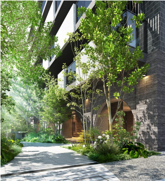
プロムナード完成予想図