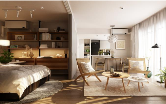
レ・ジェイドシティ橋本 I B type 室内完成予想図

専有部では、柱を室内に出さないアウトポール設計を取り入れております。『レ・ジェイドシティ橋本 I』は、コンパクトな広さで機能性・快適性を追求したシングル・デュックス向け、『レ・ジェイドシティ橋本 II』は、使いやすさにこだわった設備・仕様と豊富な収納を設けたファミリー向けのプランとし、多様なライフスタイルに合う住空間を提供します。