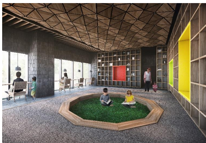
キッズスペース完成予想図