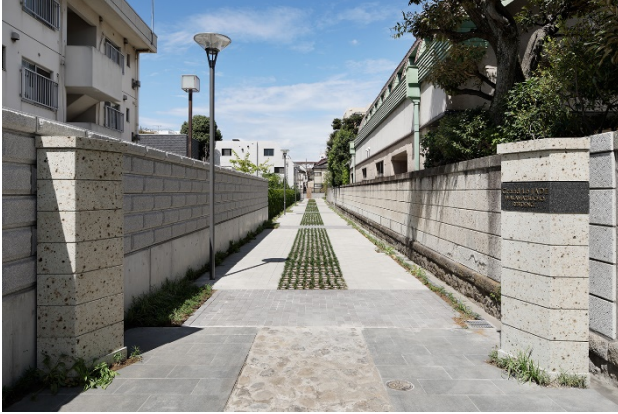
馬車の轍を想起させるアプローチのデザイン