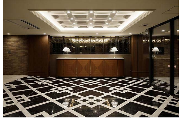
元々あった洋館の記憶を承継したデザイン

当物件は、『豊かな自然環境とプライバシー・セキュリティの確保の両立』を実現した都市型集合住宅です。