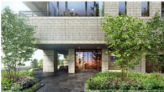
エントランス完成予想図