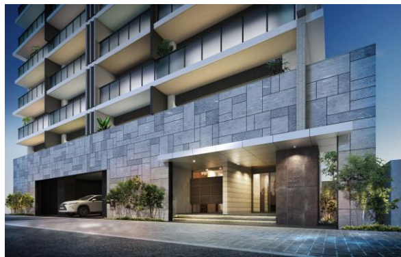
エントランスアプローチ完成予想図