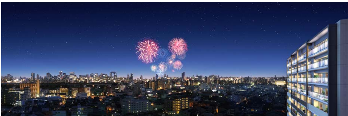
『ネバーランド西中島南方』上層階から望む淀川花火大会の様子（イメージ）

※掲載の完成予想図は計画段階の図面を基に描き起こしたもので、実際とは多少異なる場合があります。