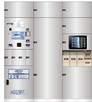
※ロッカーのイメージ図の形状は、実際のものとは異なります。

※iPad® は、米国および他の国々で登録された Apple Inc.の商標です。