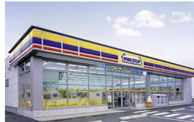
ミニストップ(店舗イメージ写真)

店 舗 名 ミニストップ 春日フォレストシティ店 開 業 日 平成 23 年 7 月 15 日 敷 地 面 積 300 坪 (991.80 ㎡)