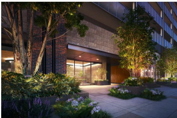
エントランスアプローチ完成予想図