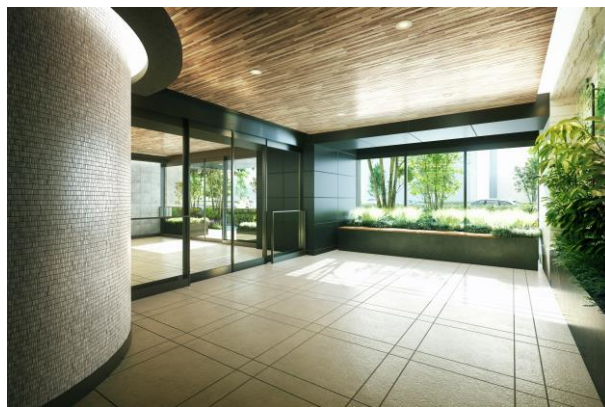
エントランスホール完成予想図