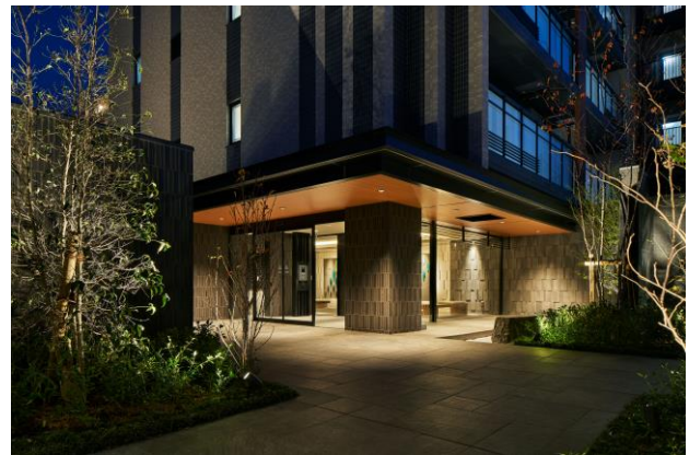
エントランスアプローチ