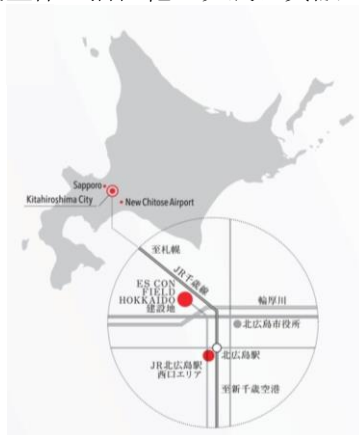
◀ F ビレッジ 及び JR 北広島駅 位置図

当社は、F ビレッジにおいて総合的な不動産開発に参画するとともに、2020年1月に新球場に係るネーミングライツを取得しております。また、2021年3月には、F ビレッジへの重要なアクセス拠点として更なる期待が集まる JR 北広島駅周辺市有地における『駅西口周辺エリア活性化事業』について北広島市とパートナー協定を締結しました。F ビレッジにおける当該事業用地での分譲事業等の開発に取り組むとともに、JR 北広島駅周辺での再開発事業にあわせて注力することで、北海道内の皆様に喜ばれ、地域全体の活性化と発展に貢献してまいります。