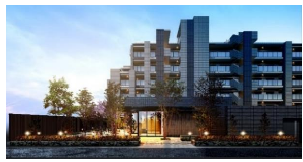
エントランスアプローチ完成予想図