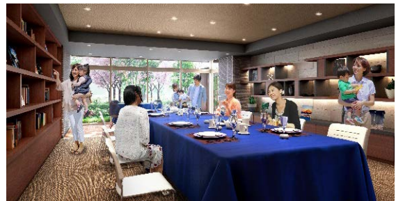
パーティー&ライブラリー(パーティースタイル)完成予想図

物 件 名 称：レ・ジェイド新金岡パークフィールズ 所 在 地：大阪府堺市北区新金岡町2丁5番18(地番) 交 通：Osaka Metro 御堂筋線「新金岡」駅徒歩4分 構 造・規 模：鉄筋コンクリート造地上11階建 総 戸 数：204戸(他に管理室1戸、ゲストルーム1戸、 パーティー&ライブラリー<集会室>1戸) 入 居 予 定：2019年10月下旬