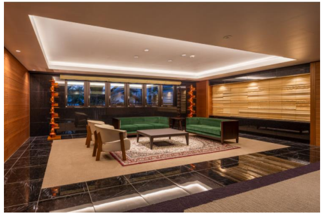
オーナーズラウンジ