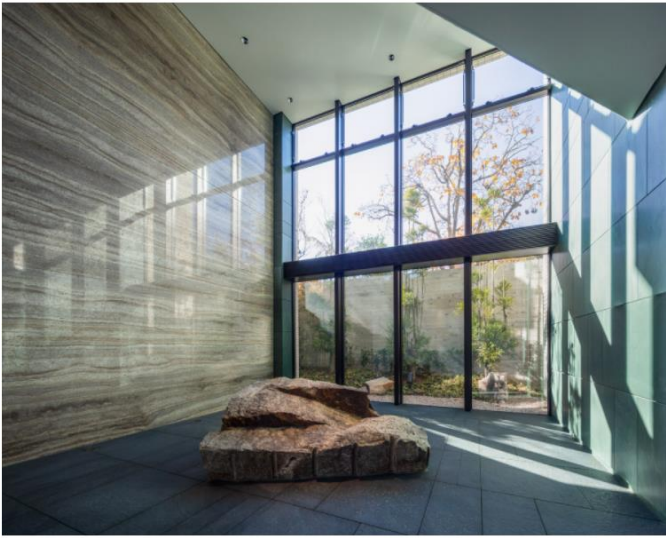
ギャラリーホール