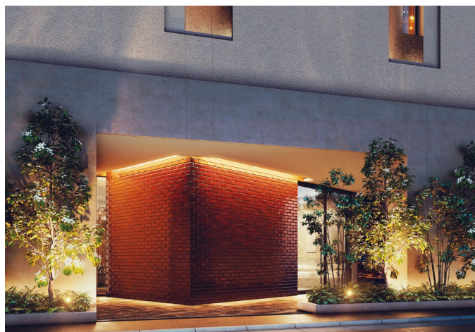
エントランス完成予想図