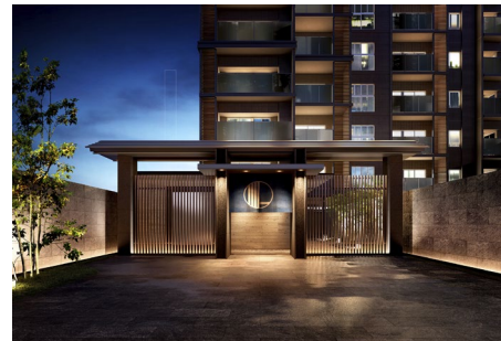
ゲートアプローチ完成予想図