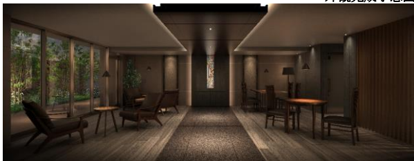
ミーティングルーム完成予想図