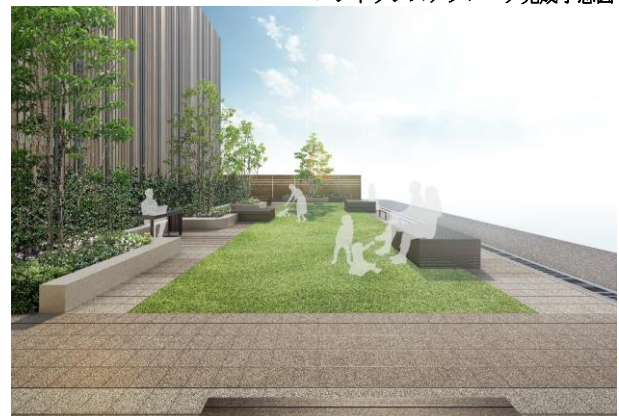
プレイロット完成予想図