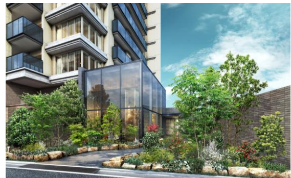
エントランスアプローチ完成予想図