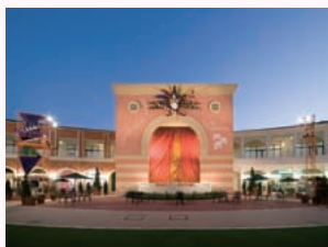
▲コミュニティの場を提供する公園劇場