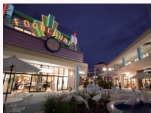
▲ゾーンごとに様々な表情を持つモール内部