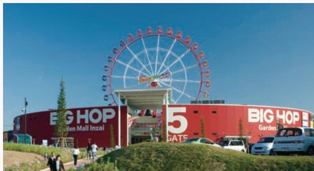
▲地域のランドマークとなる観覧車を設置（外観）

不動産ビジネスで培ってきた総合力を活用し、 環境・ニーズに適した物件を提供しています。